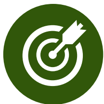
Consultoría en Modelo de Negocio

¡Nuestro servicio B2B Digital Channel dota y capacita a tus vendedores con las herramientas básicas necesarias para desarrollar campañas en medios digitales!