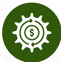
Acciones de seguimiento automatizados para negocios