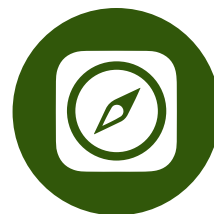
LinkedIn Sales Navigator