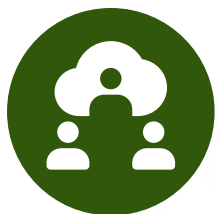
Coaching en Reuniones Virtuales