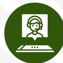
Chat para atención Online