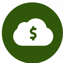
Aplicaciones Cloud para Ventas